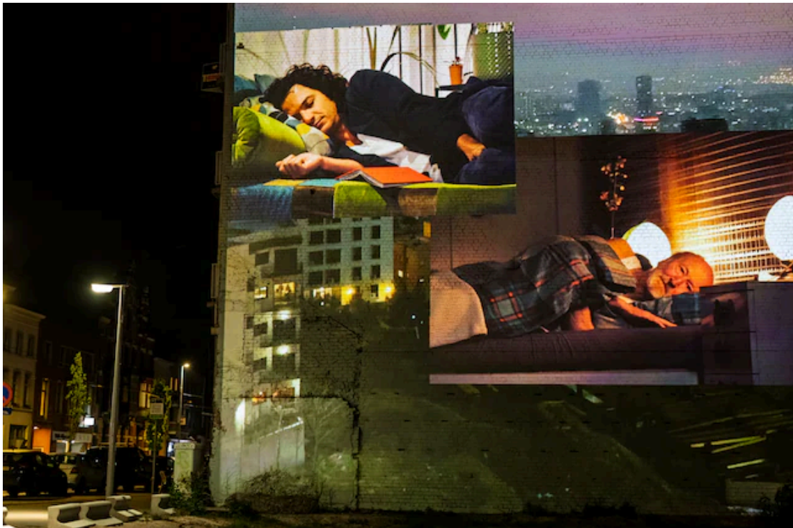
'Living Apartment Together'. Koen Broos

Flirten op straat, zoenen in de lift, en hevig vrijen als ze eenmaal op de bovenste verdieping van het appartementencomplex zijn