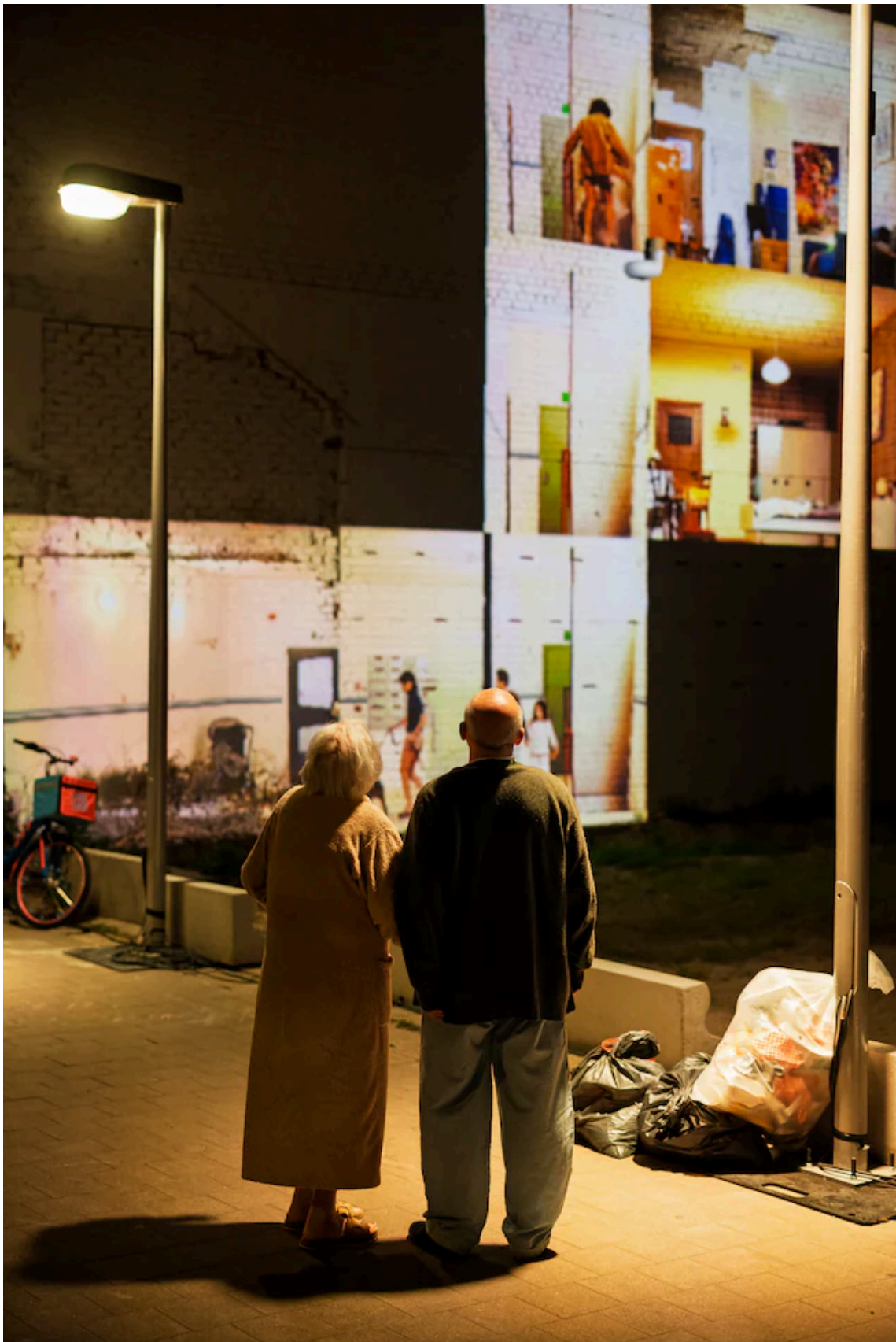
'Living Apartment Together' Koen Broos

Degryse last gedurende de voorstelling in toenemende mate vervreemdende elementen in – ontregelende muziek, vuurwerk, abstracte projecties – waardoor de voorstelling wordt behoed wordt voor te veel documentair realisme.